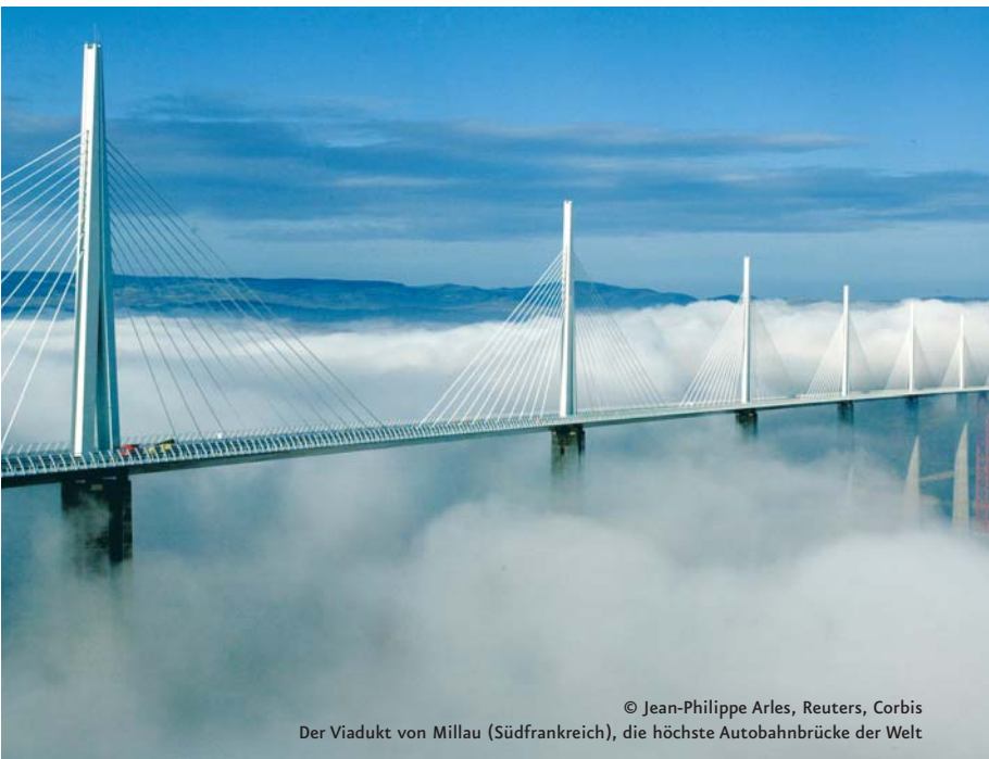
Der Viadukt von Millau (Südfrankreich), die höchste Autobahnbrücke der Welt