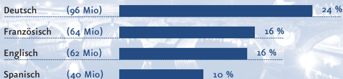
DIE WICHTIGSTEN MUTTERSPRACHEN IN EUROPA (ANTEIL AN DER EUROPÄISCHEN GESAMTBEVÖLKERUNG)

Englisch ist zwar heute unbestritten die wichtigste Verkehrssprache. Aber für optimale Berufsaussichten braucht man mehr als eine Fremdsprache. Eine zweite oder dritte Fremdsprache zu beherrschen wird so immer mehr zur Schlüsselqualifikation. Französisch – nach Deutsch die am meisten gesprochene Muttersprache in Europa – zahlt sich hier aus.